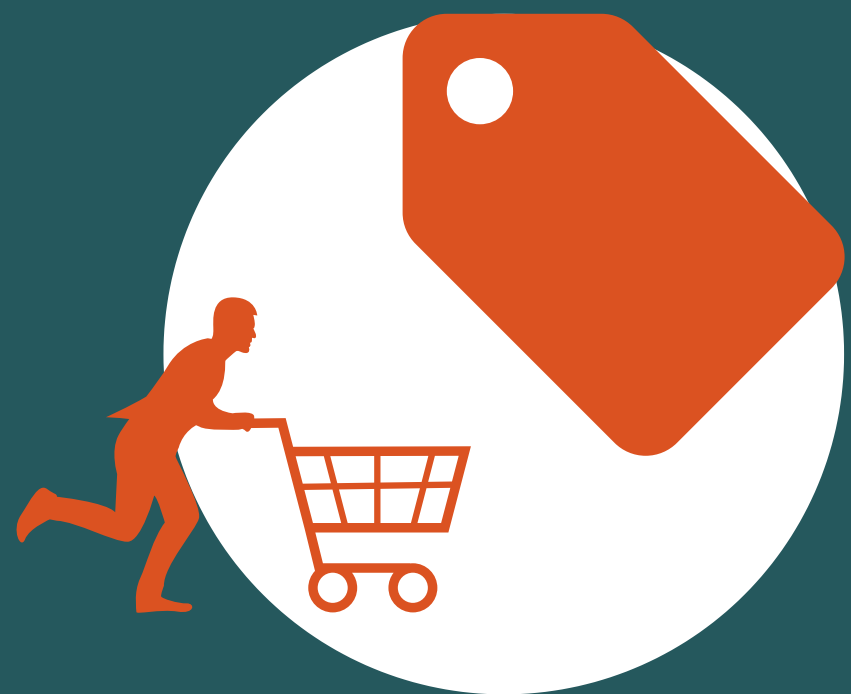
PAGAMENTO À VISTA, COM DESCONTO (38%)